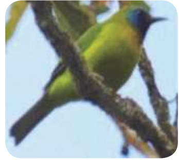
Cica daun sumatra ( Chloropsis venusta ) famili Chloropseidae .

Pulau Sumatera memiliki kekayaan jenis burung tertinggi kedua setelah Papua (628 jenis burung). Sebagai salah satu DPB di Sumatera, kawasan ini sangat penting dipertahankan untuk pelestarian satwa khususnya jenis burung.