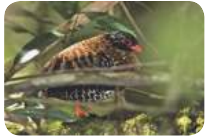
Puyuh gonggong sumatera ( Arborophila rubrirostris ) famili Phasianidae.

Pengamatan potensi burung di TWA Bukit Kaba dilakukan di sepanjang jalur-jalur ekowisata. Berdasarkan data yang ada, teridentifikasi 84 jenis burung yang berasal dari 27 famili.