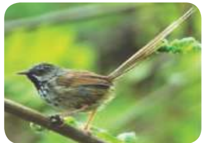
Perenjak gunung ( Prinia artogularis ) famili Silvidae