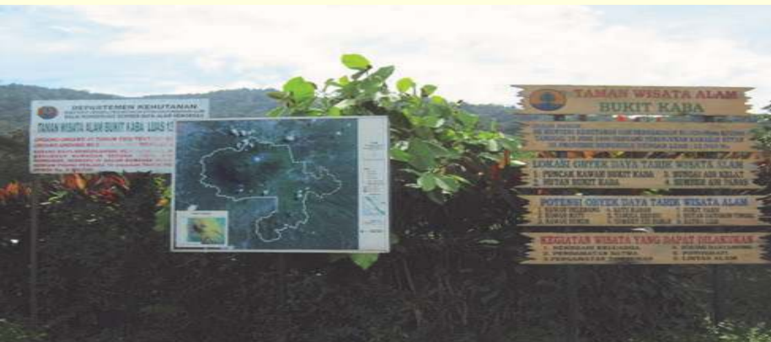
Papan informasi kawasan TWA Bukit Kaba

penelitian Hutahayan (2012), tidak dijumpai wisatawan yang berkunjung ke kawasan dengan tujuan wisata budaya. Hal ini cukup memprihatinkan mengingat potensi atraksi wisata budaya cukup tinggi. Namun, hal ini dapat dimengerti mengingat belum adanya pengelolaan atraksi kebudayaan dan kesenian masyarakat desa. Misalnya, belum ada jadwal waktu dan tempat pertunjukan seni budaya seperti tradisi sedekah bumi atau kesenian Kuda Kepang.