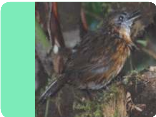
Berencet dada-karat ( Naphotera rufipectus ) famili Timaliidae

Berkebalikan dengan kekayaan jenis burung yang dimilikinya, Sumatra memiliki tingkat endemisitas burung yang rendah, hanya 11,8 % (44 jenis burung endemik) dari jumlah seluruh burung endemik Indonesia atau urutan nomor kedua terbawah setelah Kalimantan. Hal ini terjadi karena secara geografis pulau Sumatera ini memiliki tingkat keterisolasian yang relatif rendah. Terdapat enam jenis burung endemik Sumatra terdapat pada jalur-jalur ekowisata TWA Bukit Kaba (13,6 % dari jumlah seluruh jenis burung endemik Sumatra).