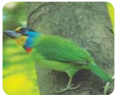
Takur bukit ( Megalaima oorti ) famili Capitonidae