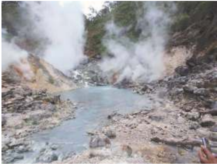
Sumber Air Panas Air Sempiang