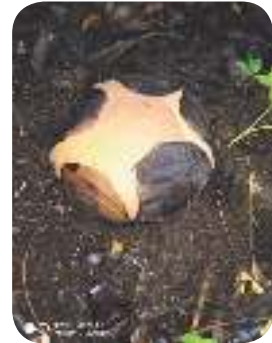
Knop bunga Rafflesia