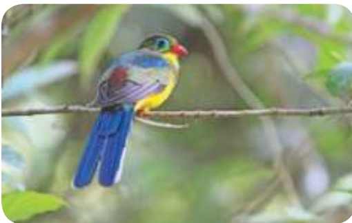
Luntur gunung sumatera ( Apalharpactes mackloti ) famili Trogonidae

Hampir seluruh jenis burung yang dijumpai dalam pengamatan ini merupakan jenis penetak. Tidak ada satupun burung migran yang berhasil teridentifikasi dalam kegiatan. Jenis-jenis burung yang teridentifikasi pada jalur-jalur ekowisata di kawasan ini adalah dari famili Timaliidae (10 jenis), famili Picidae (8 jenis), Muscicapida (7 jenis), family Columbidae (6 jenis), famili Accipitridae dan Sylvidae (5 jenis), family Capitonidae ; Campephagidae ; dan Turdidae (masing-masing 4 jenis), family Cuculidae ; Chloropseidae ; Pycnonotidae ; dan Dicruridae (masing-masing 3 jenis), famili Stigidae ; Trogonidae ; Eurylaimidae ; Dicacidae ; dan Zosteropidae (masing-masing 2 jenis). Untuk burung-burung dari famili Phasianidae ; Psittacidae ; Bucerotidae ; Corvidae ; Paridae ; Sittidae ; Laniidae ; Rhipiduridae ; dan Nectariniidae , hanya teridentifikasi masing-masing satu jenis.